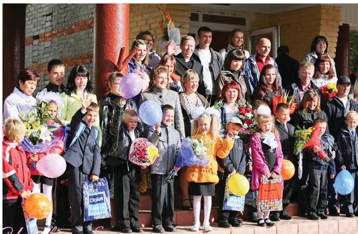
Первоклашки Ловозера и их родители.